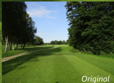
Fotomontage, se även nästa sida större skala