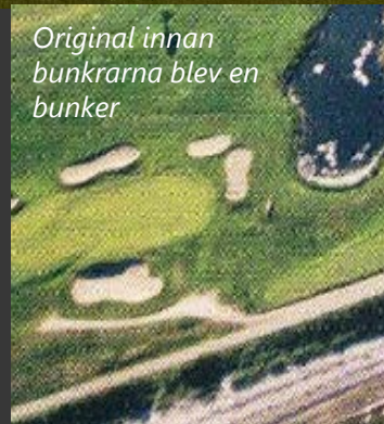
Original innan bunkrarna blev en bunker