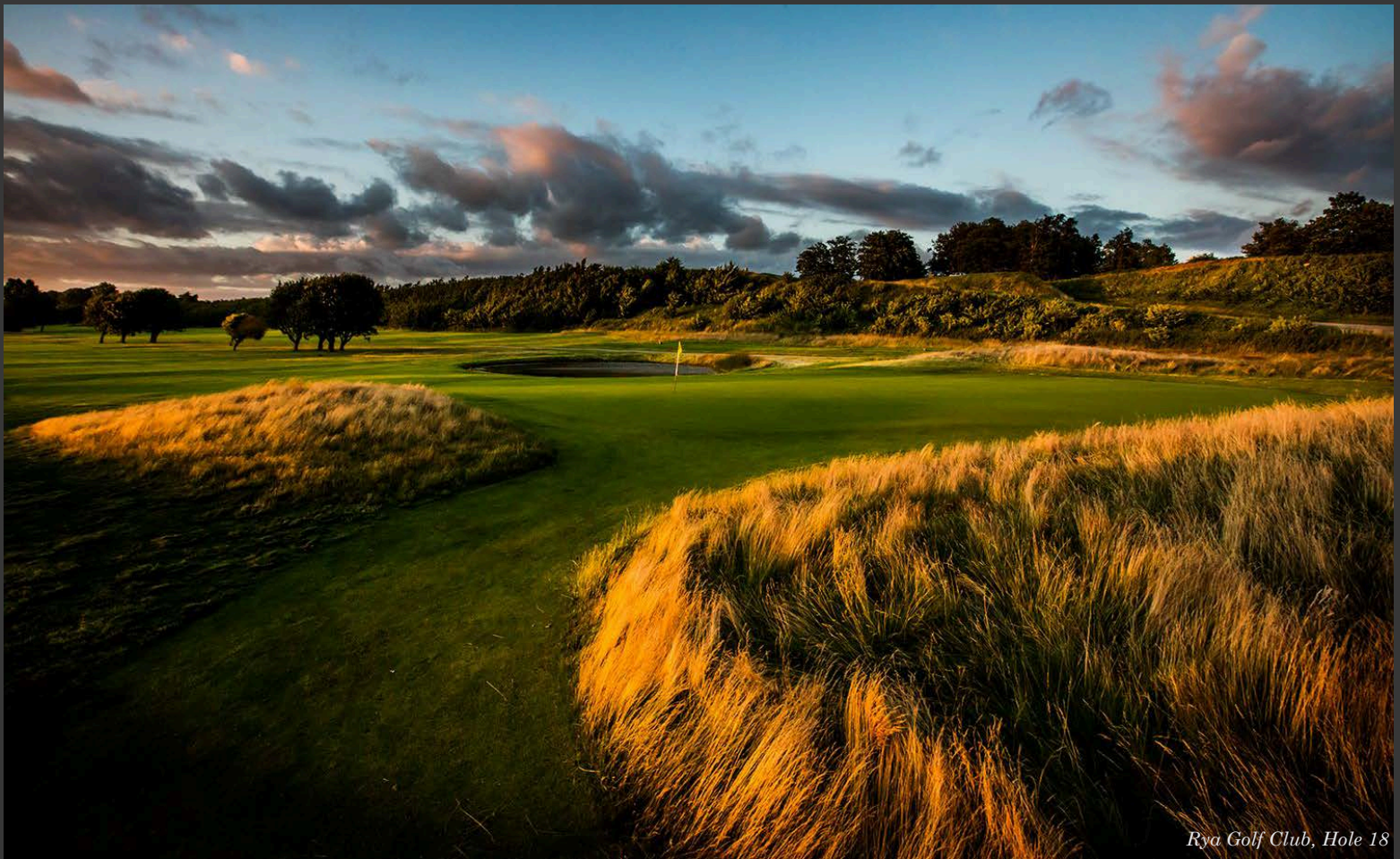
Rya Golf Club, Hole 18